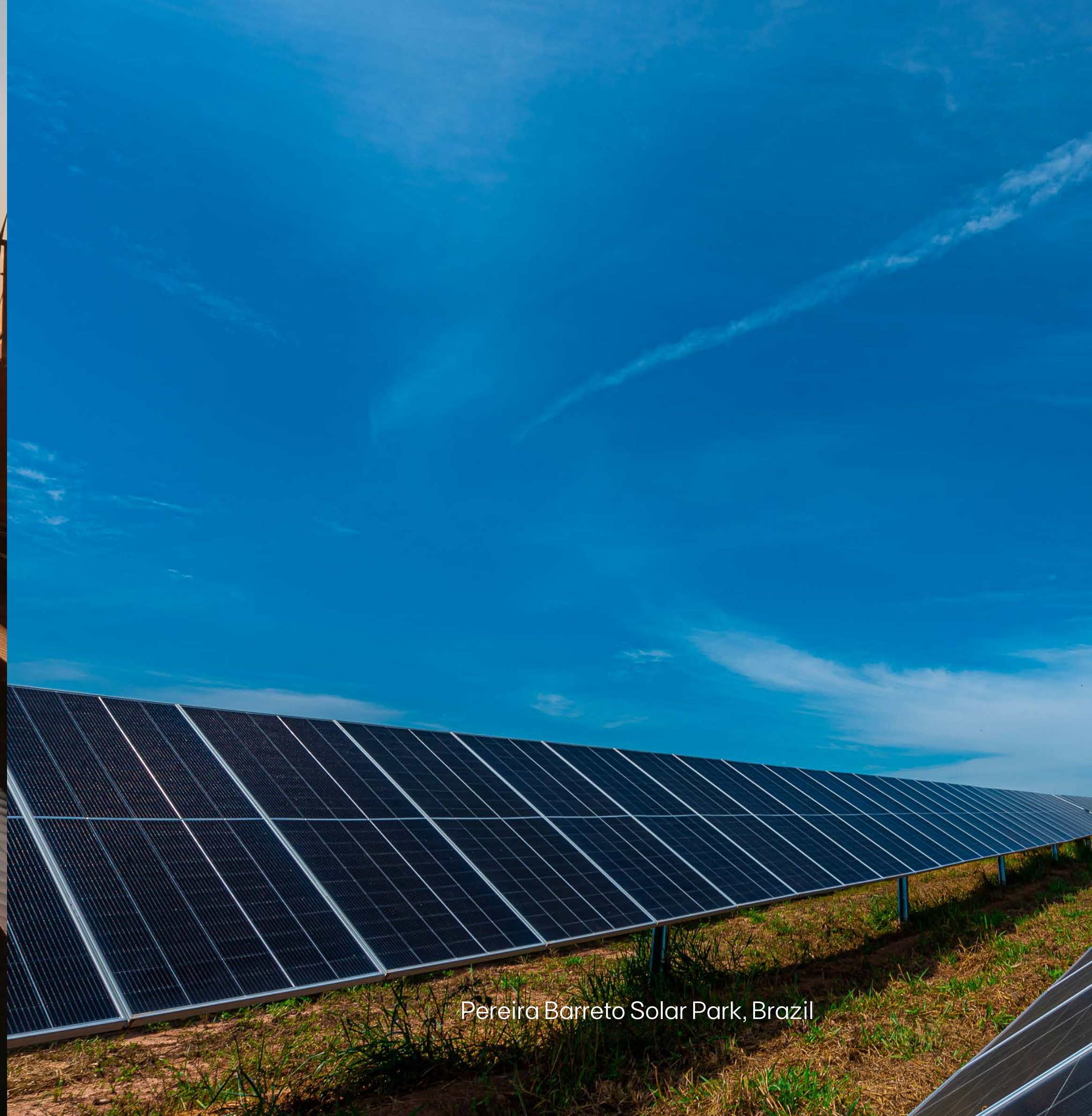
Pereira Barreto Solar Park, Brazil